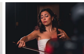
Astrig Siranossian, violoncelle.